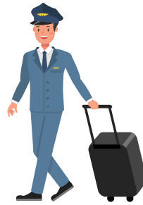
der Flugbegleiter สจ๊วต