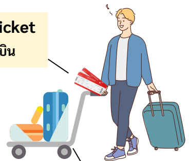
der Gepäckwagen รถเข็นกระเป๋า