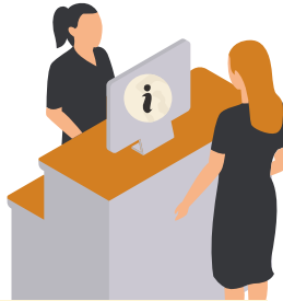
der Informationsschalter เคาน์เตอร์ประชาสัมพันธ์