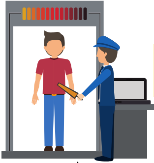
die Sicherheitskontrolle ด่านตรวจความปลอดภัย