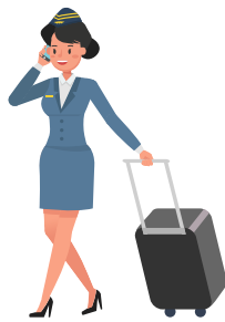
die Flugbegleiterin แอร์โฮสเตส