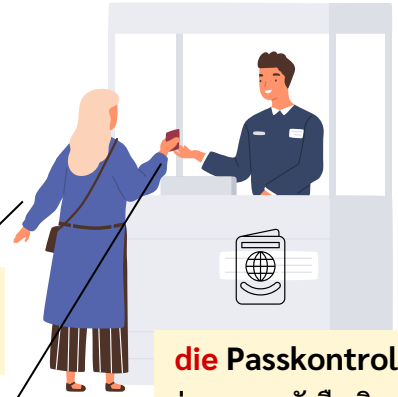
die Passkontrolle ด่านตรวจหนังสือเดินทาง