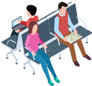
der Wartebereich พื้นที่นั่งรอ